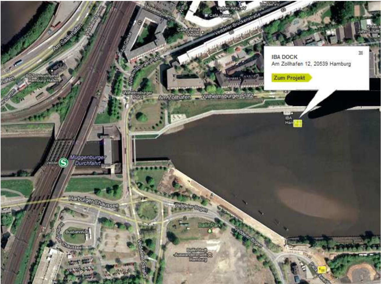
HVV: S3/31 Veddel